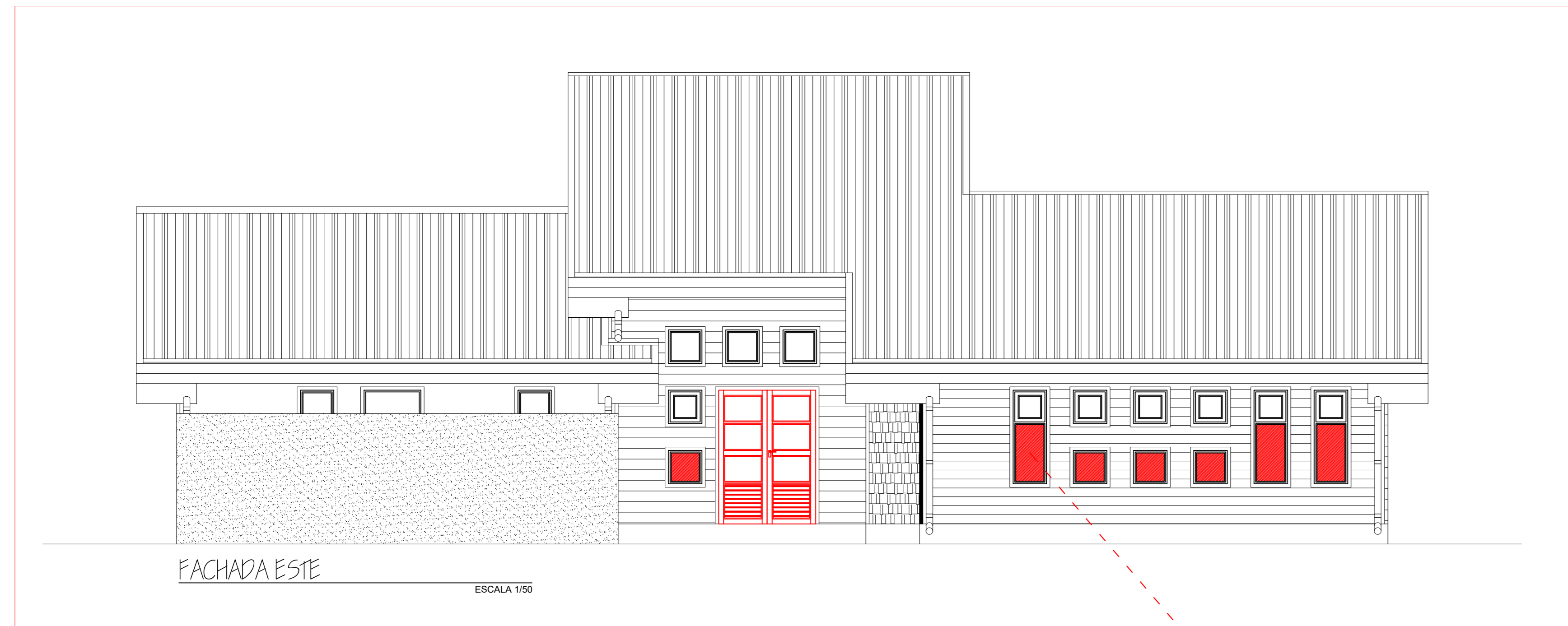
ELEVACION LATERAL DERECHA JARDIN

DIBUJO CAD: DAVID GARCÍA GONZÁLEZ, FABIAN BARRIENTOS MANSILLA