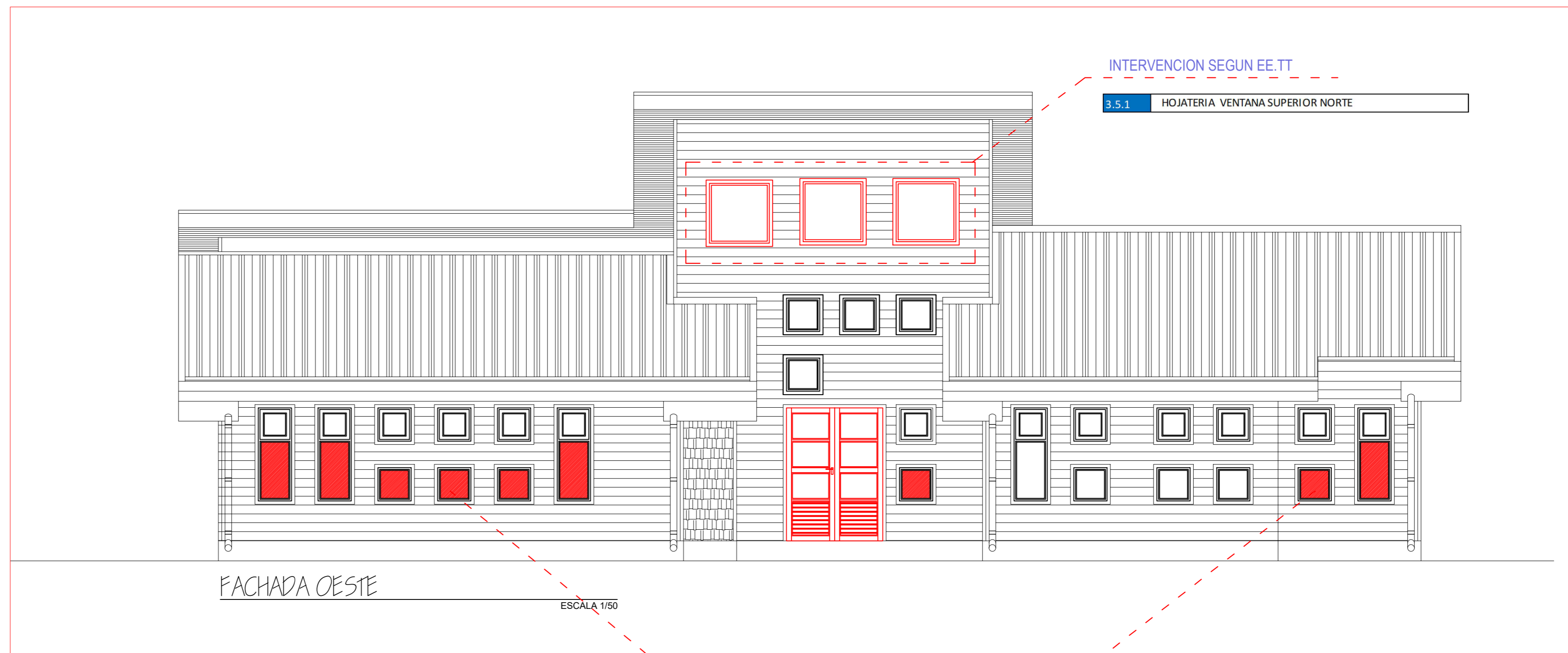
ELEVACION LATERAL IZQUIERDA JARDIN